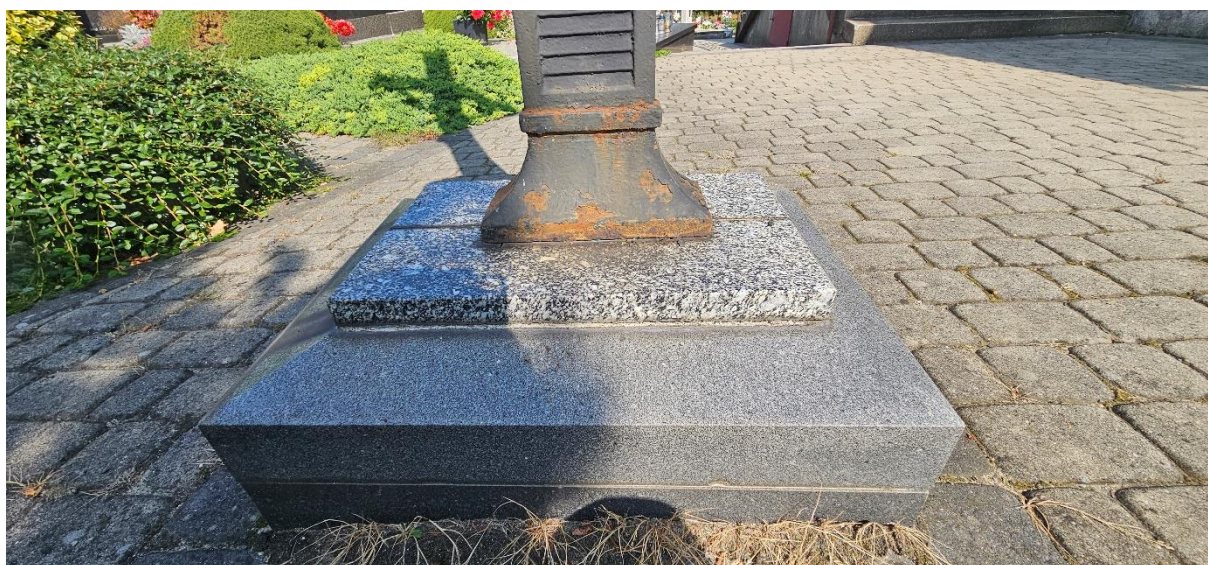
Granitowa podstawa krzyża. Widok na wprost.