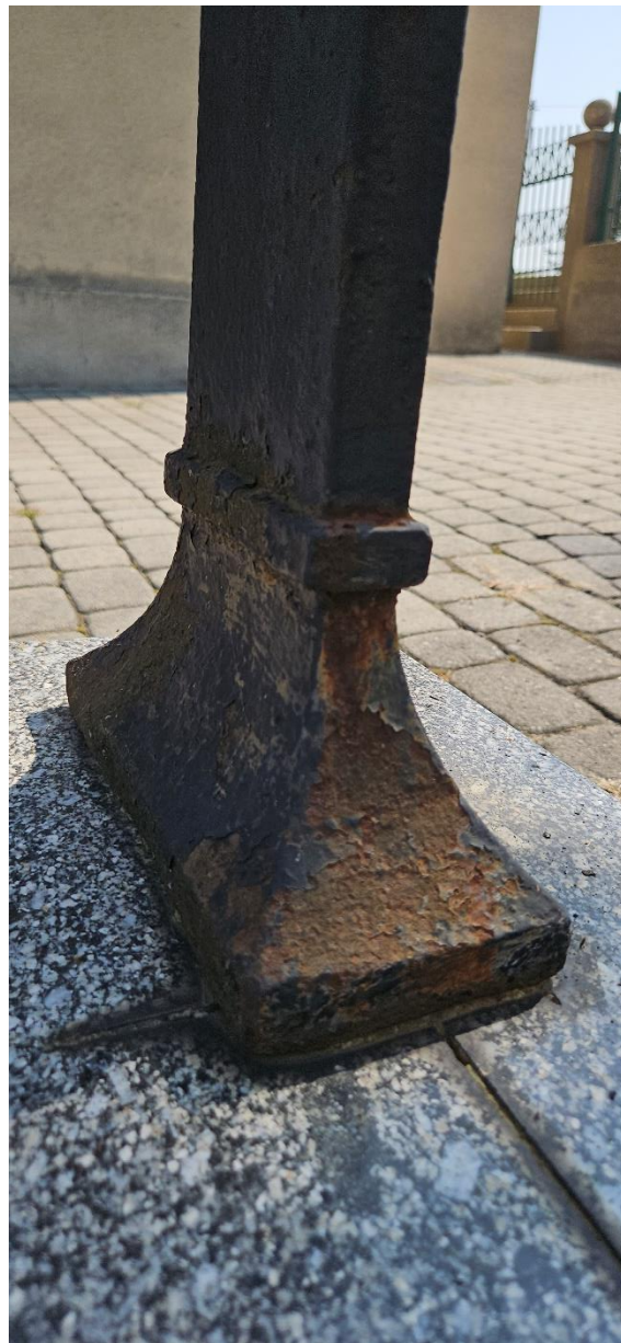
Stopa krzyża, widoczna korozja metalu, ubytki farby i powstałe wżery na powierzchni. Stan obiektu przed konserwacją.