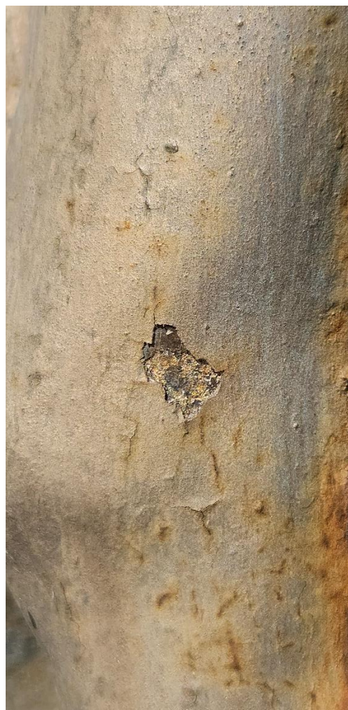
Figura Chrystusa Ukrzyżowanego, fragmenty przedstawienia. Widoczna naturalna odkrywka z oryginalnym złoceniem powierzchni. Stan przed konserwacją.