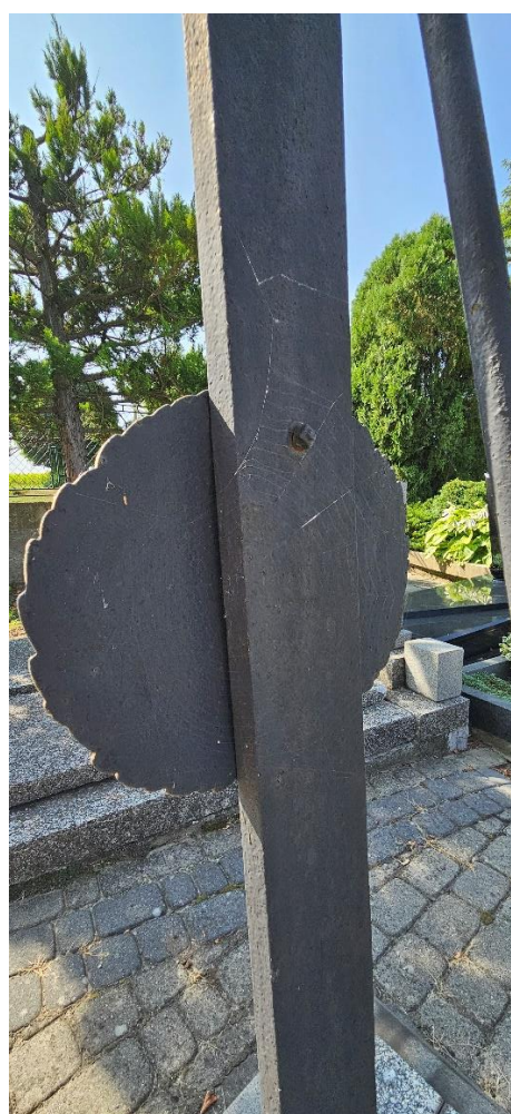
Tył krzyża, montaż plakiety i zastrzału. Stan przed konserwacją.