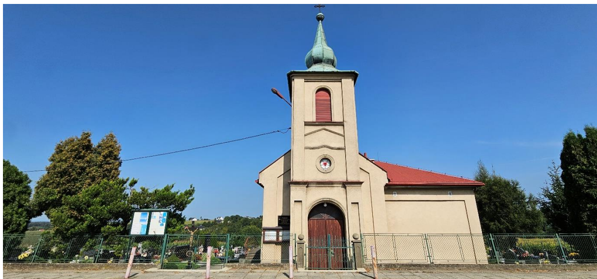
Widok cmentarza i kościoła św. ap Piotra i Pawła od strony ul. Cieszyńskiej.

Krzyż cmentarny znajduje się na swoim historycznym miejscu usytuowania, w sąsiedztwie pasa drogowego przy ul. Cieszyńskiej, na otwartym terenie cmentarza ewangelickiego w Zamarskach. Poziom cmentarza obniżony jest w stosunku do drogi o ok. 90 cm. Krzyż narażony jest na nieustanne oddziaływanie warunków atmosferycznych i drogowych zanieczyszczeń.