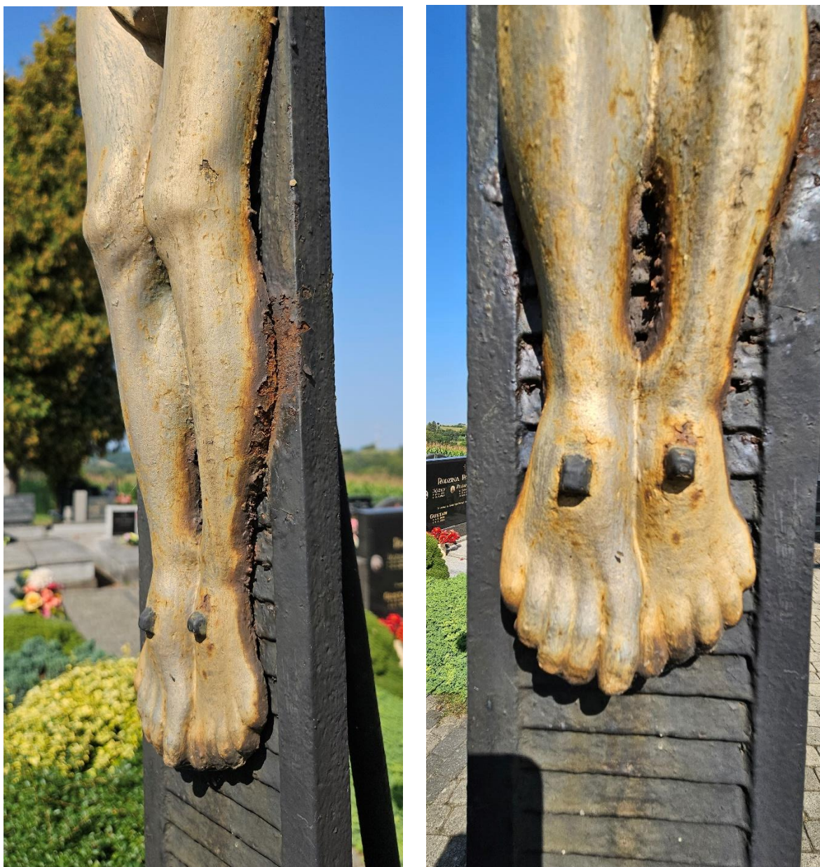
Figura Chrystusa Ukrzyżowanego, fragment przedstawienia. Widoczna korozja dolnych partii odlewu i uszkodzenie krawędzi. Stan przed konserwacją.