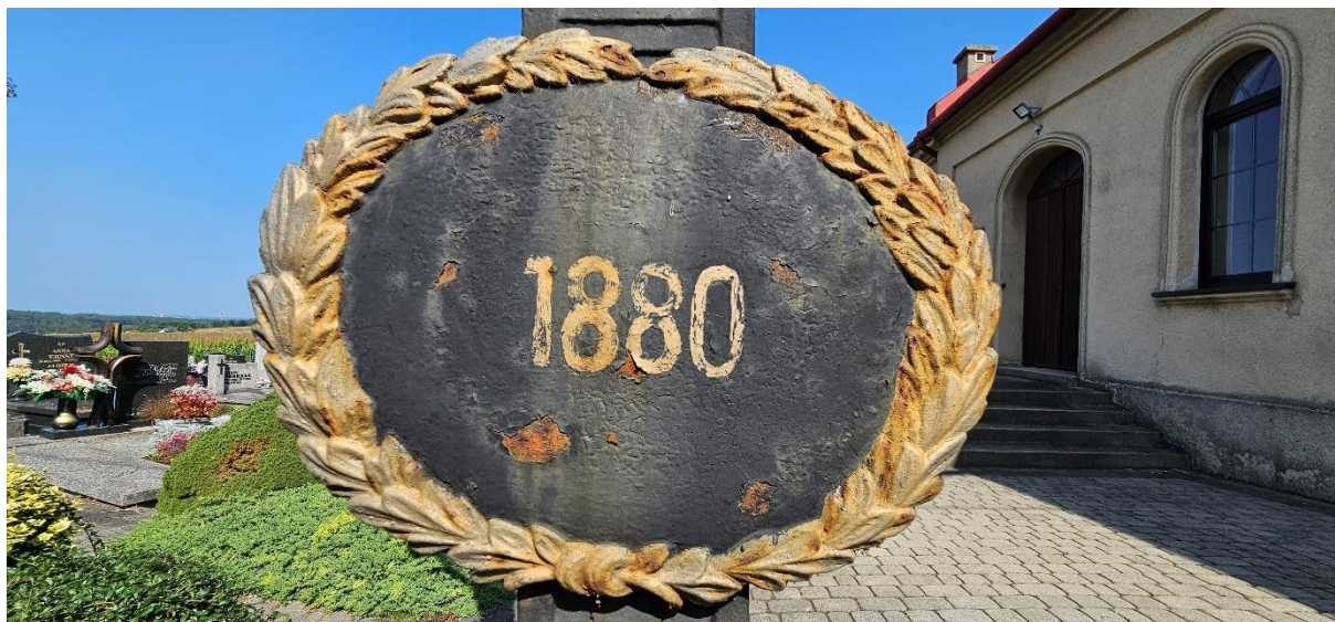
Plakieta z datą fundacji krzyża i powstania cmentarza. Widok na wprost. Stan przed konserwacją.