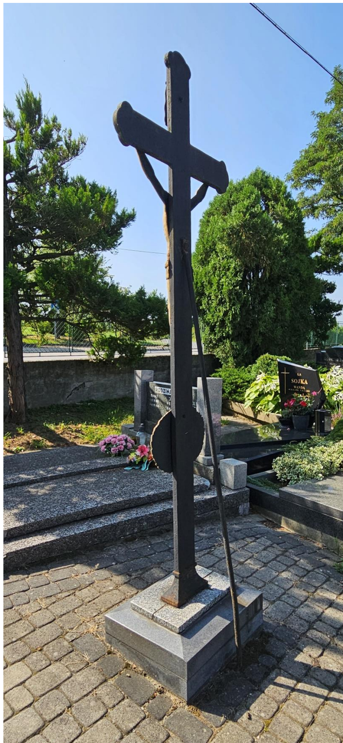
Stan obiektu przed konserwacją. Widok tyłu w ujęciu ¾.