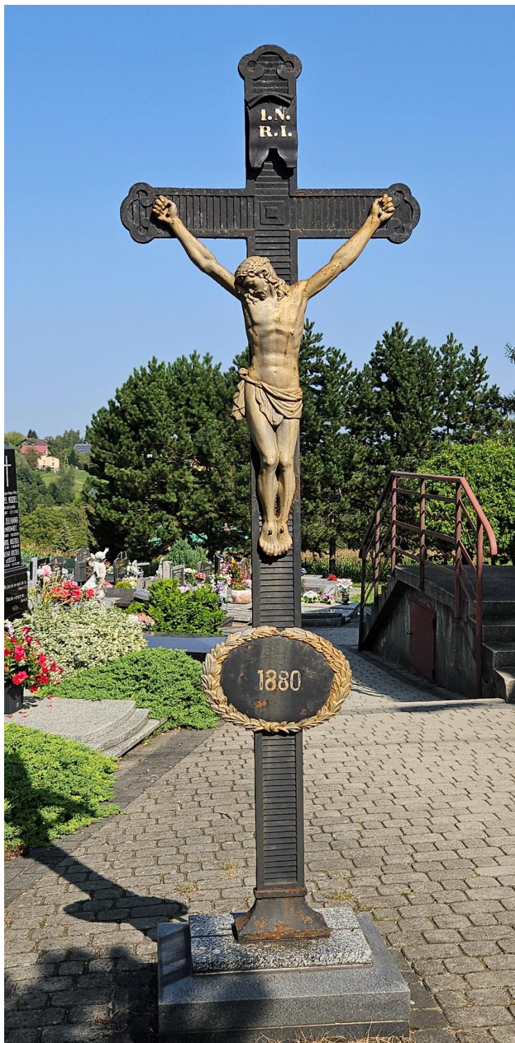
Stan obiektu przed konserwacją. Widok na wprost.