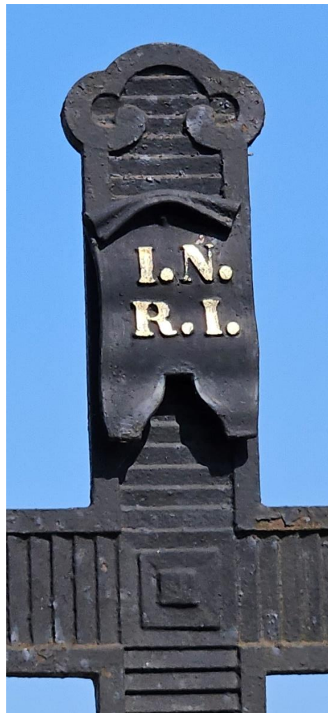
Ozdobne, profilowane lico krzyża, widok tabliczki z inskrypcją INRI.