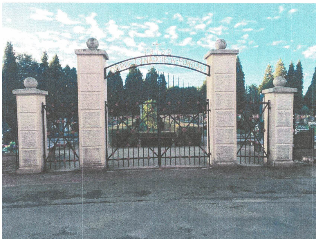
Fot. 2.: Brama na nowym cmentarzu – stan obecny