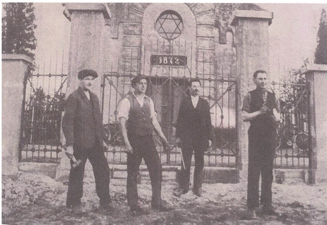
Fot 1.: Brama na nowym cmentarzu – lata 30-te XX wieku