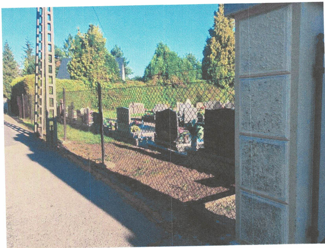
Fot. 4.: Współczesne ogrodzenie cmentarza podlegające wnioskowanej wymianie