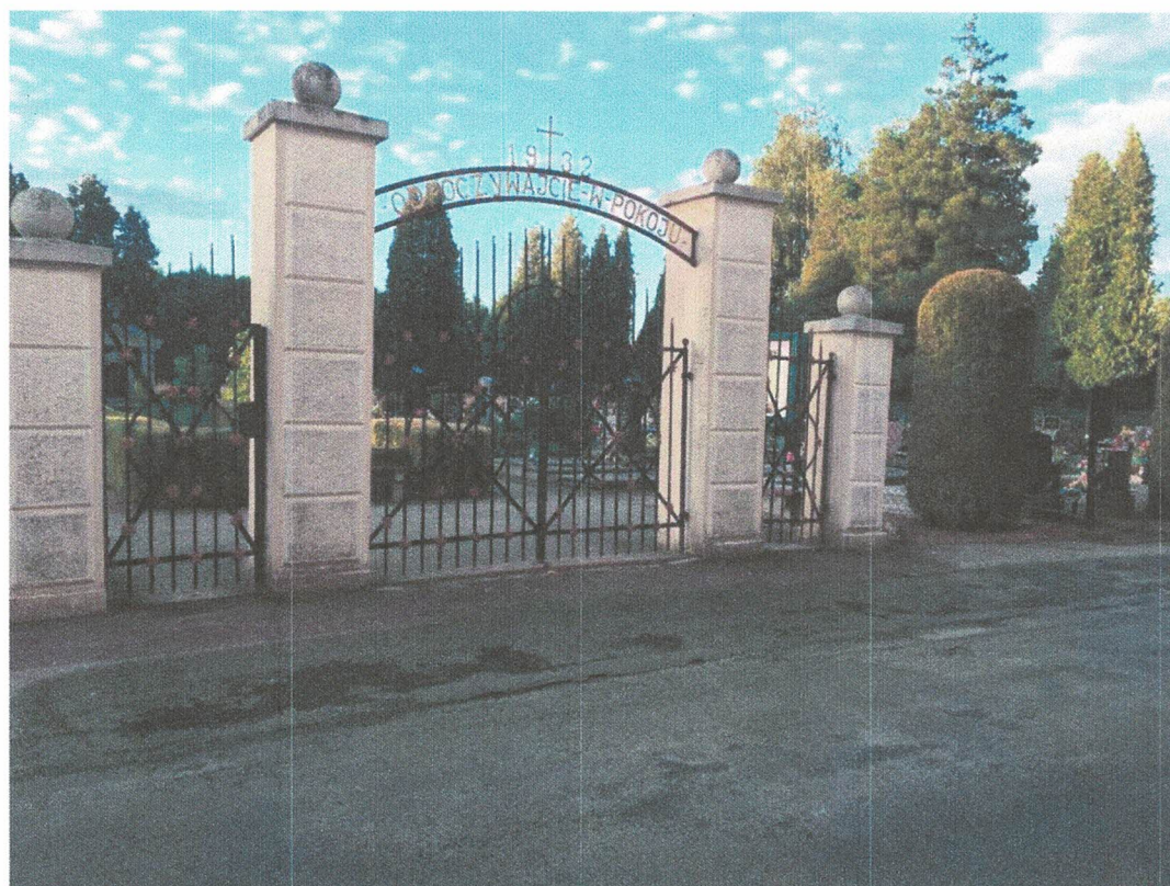
Fot. 3.: Brama na nowym cmentarzu – stan obecny